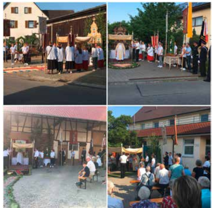
Blumentepiche in Dieterskirch