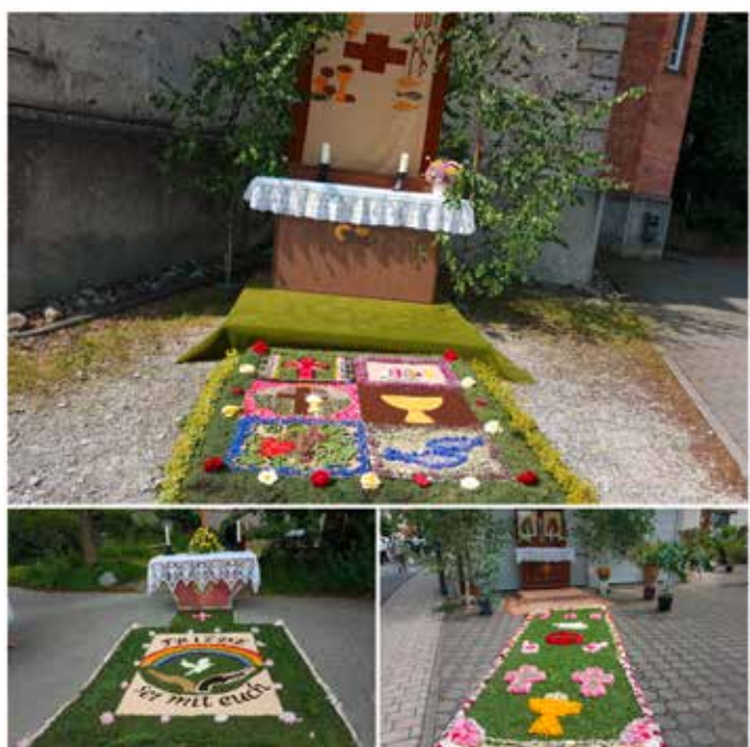
Blumentepiche in Uttenweiler