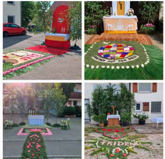
Blumentepiche in Sauggart