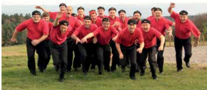
Der Männerchor Bräschdleng im Ansturm auf das 39. Weinfest der SF Bussen

Lassen sie sich die süßen Früchtchen aus Birkenhard nicht entgehen und genießen sie einen schönen Abend mit Bräschdleng bei den SF Bussen in Dieterskirch. Der Kartenvorverkauf zur Vorstellung bei den SF beginnt am 1. Oktober. Vorverkaufsstellen sind in der Bäckerei Binder in Munderkingen, sowie in den Voba-Raiba Filialen in Dieterskirch, Unlingen und Uttenweiler.