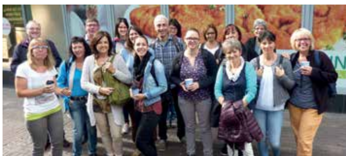
„Die besten Schnitzel“ ermitteln

Am letzten Feriensontag fanden wir uns im Innenhof des Polizeipräsidiums in Ulm ein, um den „Mord im Ofaschlupfr“ aufzuklären. Wir wurden in zwei Gruppen aufgeteilt und ermittelten jeweils auf eigene Faust. Eine Tatortbegehung und das Vernehmen der drei Hauptverdächtigen führte schließlich zur Lösung des Falles: Beide Gruppen konnten den Täter ausfindig machen. Fazit: Der Mörder ist nicht immer der Gärtner!