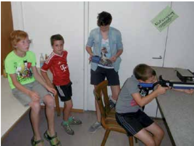
Vor allem das Lichtpunktgewehr hatte es den jungen Teilnehmern angetan