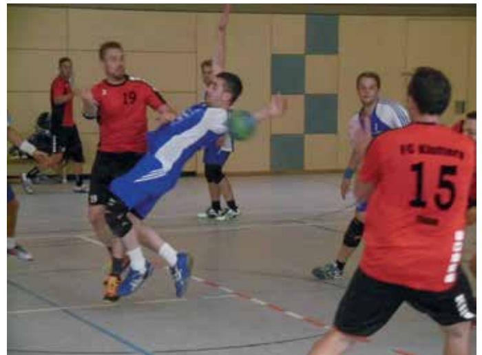
Auch in den Vorbereitungsspielen war der Einsatz groß

Aufgrund der Neueinteilung der Ligen ist eine Prognose schwierig, unter einige altbekannte Mannschaften mischen sich auch neue Teams aus Blaustein bzw. Langenau, deren Spielstärke noch nicht einschätzbar ist. Somit wäre wahrscheinlich ein Platz im Mittelfeld schon ein annehmbares Ziel für die Mannschaft um das Trainergespann Heiko Griebel/Rene Tschuschke.